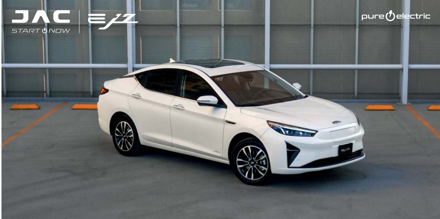
*Imagen representativa, el equipamiento puede variar